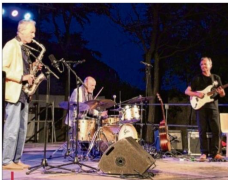
Autour de la fontaine, les élèves de l'école de musique mais aussi des musiciens reconnus internationalement ont offert de beaux moments.

Le syndicat d'initiative avait un peu peur pour l'ouverture du festival sur le site du Musée de la mine de Gréasque. En effet, le concert était programmé juste avant une demi-finale finale de l'Euro de football. Mais les mélomanes étaient au rendez-vous et ce sont près de 400 personnes qui étaient présentes et ont fini debout en dansant et tapant des mains sur les rythmes de l'excellent groupe