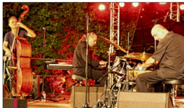
Le Frédéric Chopin Jazz Project a offert un concert magique à ciel ouvert, sous le cèdre du Théâtre de verdure.

Le week-end dernier se tenait à Gréasque la 17 e édition de Jazz en sol mineur. Grâce au soutien de ses partenaires, le festival a une nouvelle fois offert de belles rencontres musicales.