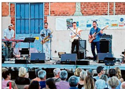
Le groupe Cissy Street.

Les deux jours suivants, les concerts gratuits installés sur le cours Ferrer autour de la terrasse du Café puis place Félix Lescurre pour dîner autour de la fontaine en centre-ville ont permis d'entendre ou de réentendre La bande à Bruzzo, Les