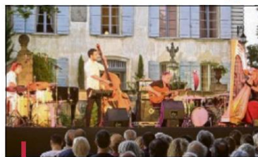
Avec ces trois jours de festival, rien ne manque pour assurer une ambiance festive dans le village.

Les 7, 8 et 9 juillet, Gréasque accueille la 14 e édition du festival "Jazz en sol mineur", organisé par le Syndicat d'initiative. L'événement a, depuis ses débuts, allier qualité et convivialité. Ce 14 e rendez-vous ne dérogera pas à la règle comme en témoigne la programmation : ouverture du festival au musée de la mine, concerts de rue à l'heure de l'apéritif, animations musicales, repas autour de la fontaine, soirées de gala au théâtre de verdure le soir. Rien ne manque pour assurer une ambiance festive dans le village. L'ouverture aura lieu demain, jeudi, à 19h30, par un concert gratuit sur le site du musée de la mine de Gréasque, pô- le historique classé. The Muddy's Street & The M.A.G.'s vont faire du bruit ! Spirit... Blues... New Orléans... Soul...Afro... Vendredi, à 18h, le collectif Swing du Sud se produira sur le cours Ferrer, toujours gratuitement. Swing chantant et endiablé, mélange festing et improvisation. À 19h30, Alexandre Bonjean et l'école de musique de Gréasque prendront le relais au cœur du village pour animer le repas autour de la fontaine de la place Félix Lescure. À 21h30, direction le Théâtre de verdure du parc du château de Gréas-