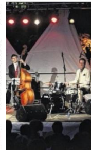
Le quartet ont conclu les trois jours de festival de Verdure.

de musique de Gréasque ont pris le relais au cœur du village pour animer ces soirées estivales dédiées au jazz. De nombreux mélomanes ont pu se restaurer sur la place de la fontaine, improvisée en terrasse de restaurant, et découvrir les spécialités proposées par le boucher traiteur du village. Les soirées musicales quant à elles se sont déroulées dans le théâtre de Verdure. C'est ainsi que Gilda Solve Quartet a entraîné tout son public dans la ferveur des grands classiques. En effet après avoir chanté divers répertoires originaux, Duke Ellington, Horace Silver, Sonny Rollins, Miles Davis, Chick Corea, Gilda a invité le public à refaire un voyage à travers les standards inoubliables du jazz. Le Swing ne pouvant être dissocié du jazz, Gilda s'était donné pour mission de nous le faire découvrir ou redécouvrir. Sa technique vocale, sa grande présence sur scène, son charme, les émotions qu'elle suscite, son contact avec le public qu'elle invite aussi à chanter sur du "scat", laissa après son concert une forte impression de joie et de plaisir. Festival réussi.