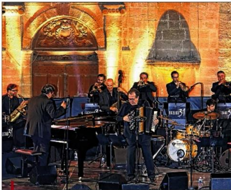
Le Big Band de Pertuis fête ses trente ans de scène le 2 juillet à Gréasque lors du festival Jazz en sol mineur.